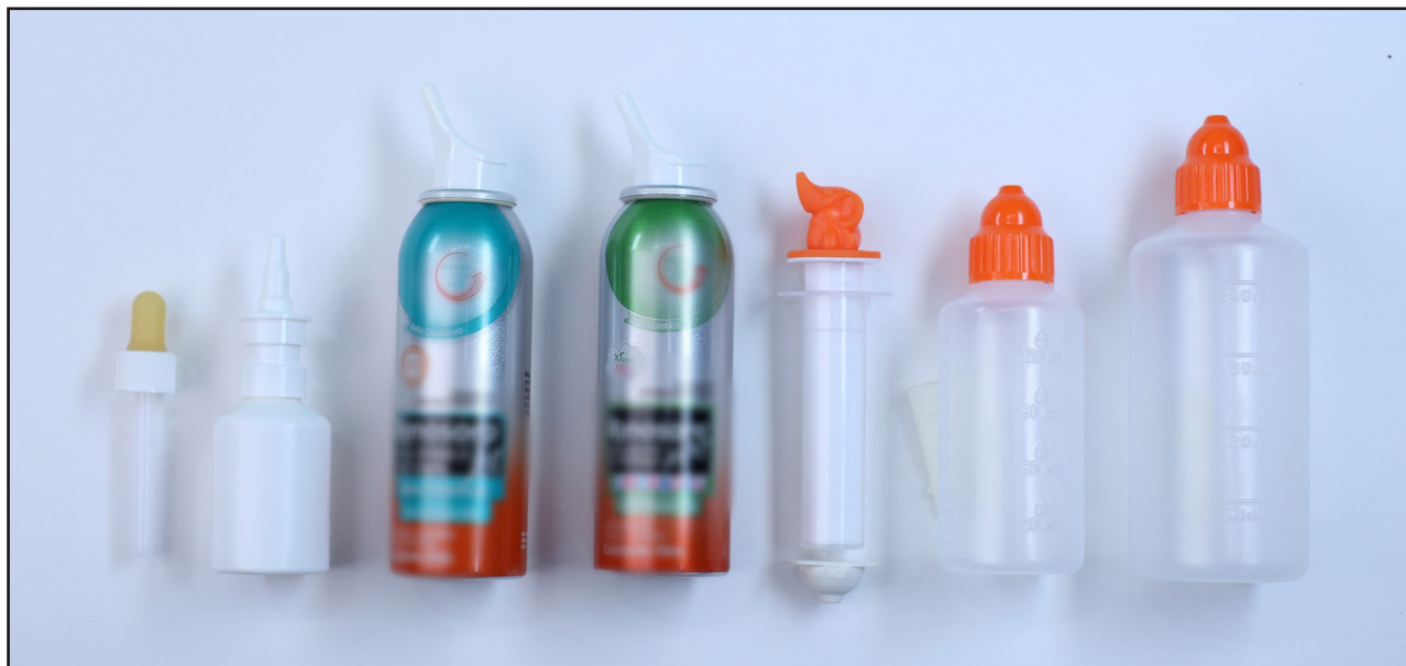
Figura 1. Apresentações de soluções para lavagem nasal.

Da esquerda para direita, conta-gotas, spray , jato contínuo, seringa, dispositivo de alto volume pediátrico e adulto.